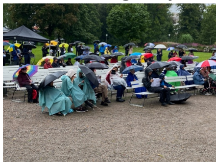
Bild från 2023. Förhoppningsvis bättre väder denna gång

18 augusti kl 11 Ekumenisk gudstjänst i Stadsparken. Immanuelskyrkan, Pingstkyrkan och S:t Mikael's församling ansvarar. Vi väntar ivrigt på affischen och kommer att skicka ut den så fort den är klar. Det kommer också att behövas medhjälpare från olika församlingar.